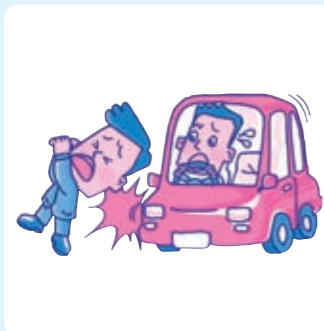
車にはねられケガをした