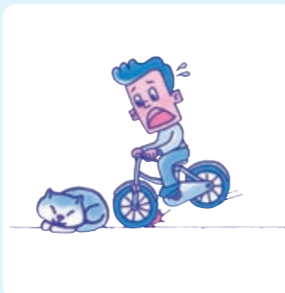
自転車でころんでケガをした